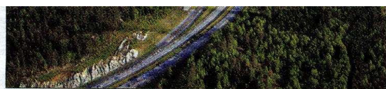
VED MOTORVEIEN: Ønsker Ski kommune fortsatt vekst, må vi også være villige til å legge til rette for næringsutvikling, skriver innsenderen.

Motocrossbanen er framstilt som et tiltak for "barn og unge", og dette er brukt for å kvele alle innvendinger. Banen har fra den ble lansert i 1999 vokst kontinuerlig, til å bli Norges største